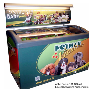
Abb.: Focus 131 GG mit Leuchtaufsatz im Kundendekor