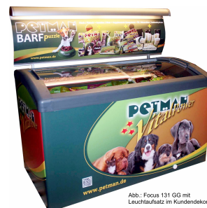
Abb.: Focus 131 GG mit Leuchtaufsatz im Kundendekor